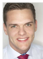
Député européen Christofer Fjellner - PPE, Suède

L'ENPA salue le fait que ces éléments ont été rejetés lors du vote le 28 septembre 2010.